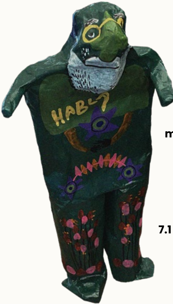
muerte de freud

SENTADO SOBRE BARRO, ME GUSTA ESTAR. NO OIGO NADA MÁS QUE EL ECO DEL SILENCIO EN EL MUNDO TRANQUILO Y EN PAZ QUIERO DEAMBULAR. NO QUIERO YA TRABAJAR; LLEVARME DESCONOCIDOS A CIERTA OSCURIDAD. SOLO DESEO SILENCIO SEPULCRAL, SOLEDAD, CALDO Y TAMAL.