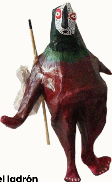
simón el ladrón

DELIA AKA BIBAIDI SÍGUELA EN @VIBAIDI PARA TRABAJOS DE LETTERING Y DISEÑO GRÁFICO